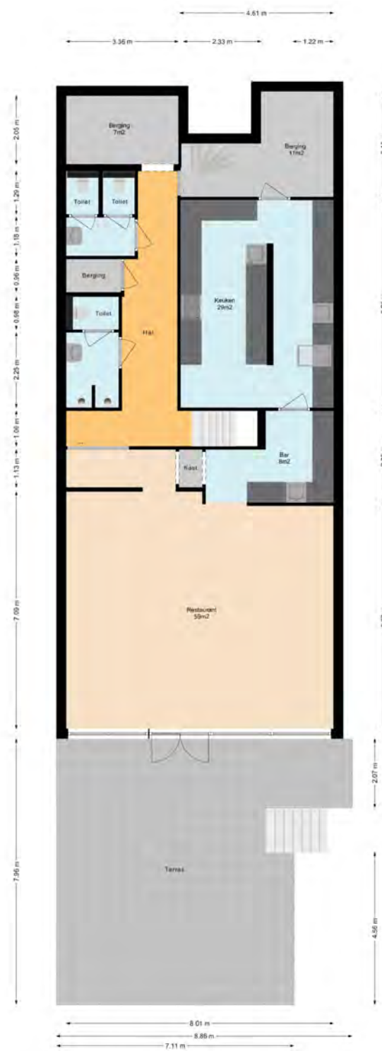
De oppervlakte van deze bouwlaag bedraagt 149 m 2 .

(Boykeys B.V. meet de oppervlakte binnen de buitenste- of gebouwscheidende wanden, inclusief binnenwanden. Van zijn naar eer en geweten en met de grootst mogelijke zorg opgesteld maar dient slechts ter indicatie en voor promotionele doeleinden. Boykeys B.V. aanvaardt geen aansprakelijkheid voor eventuele fouten en omissies. Aan deze plattegronden kunnen geen rechten worden ontleend.)