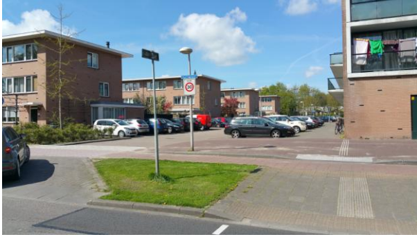
Ruime mogelijkheid voor parkeren